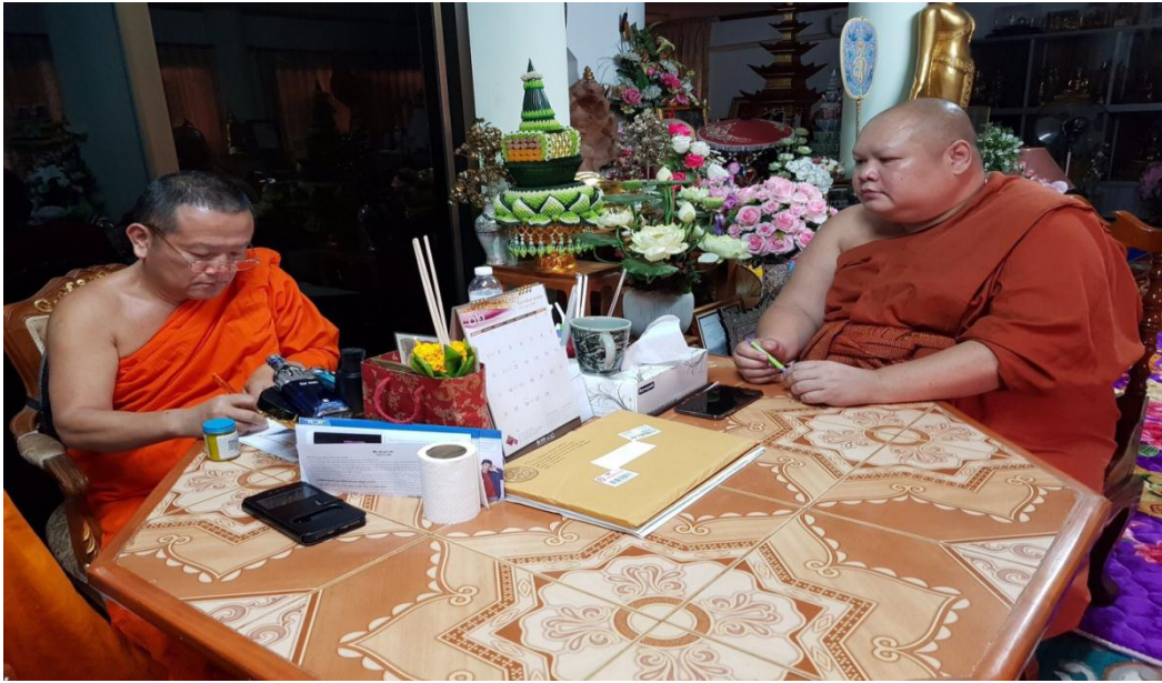
สัมภาษณ์ พระเทพรัตนนายก, เจ้าอาวาสวัดพระธาตุศรีบุญชัยวรมหาวิหาร, เจ้าคณะจังหวัดลำพูน, ๑๒ กุมภาพันธ์ ๒๕๖๒