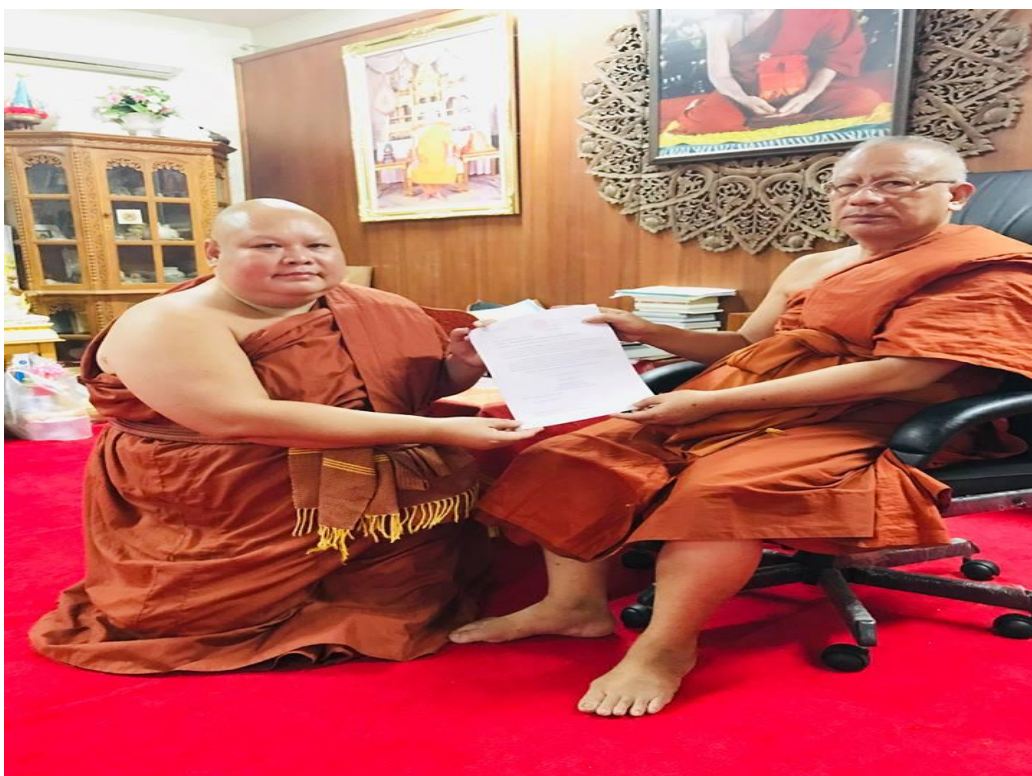
สัมภาษณ์ พระพุทธบาทพิทักษ์, เจ้าอาวาสวัดพระพุทธบาทตากผ้า, เจ้าคณะอำเภอป่าซาง, ๑๐ กุมภาพันธ์ ๒๕๖๒.