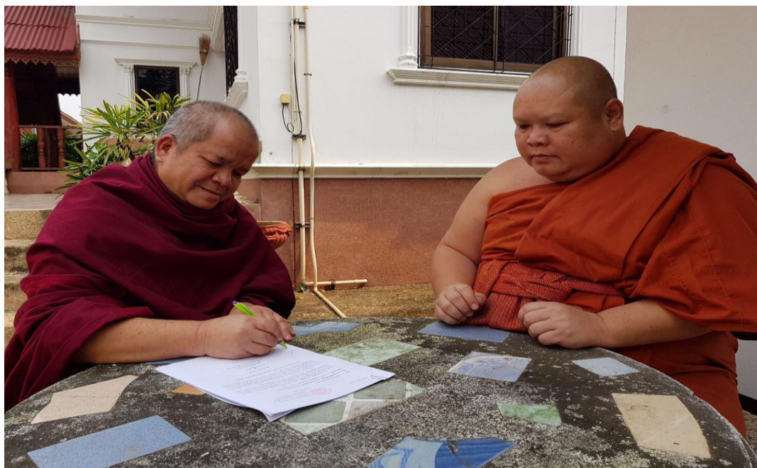
สัมภาษณ์ พระครูปริยัติกิจพัฒนา, เจ้าอาวาสวัดท่าต้นจิว, เจ้าคณะตำบลปากบ่อง, ๑๐ กุมภาพันธ์ ๒๕๖๒